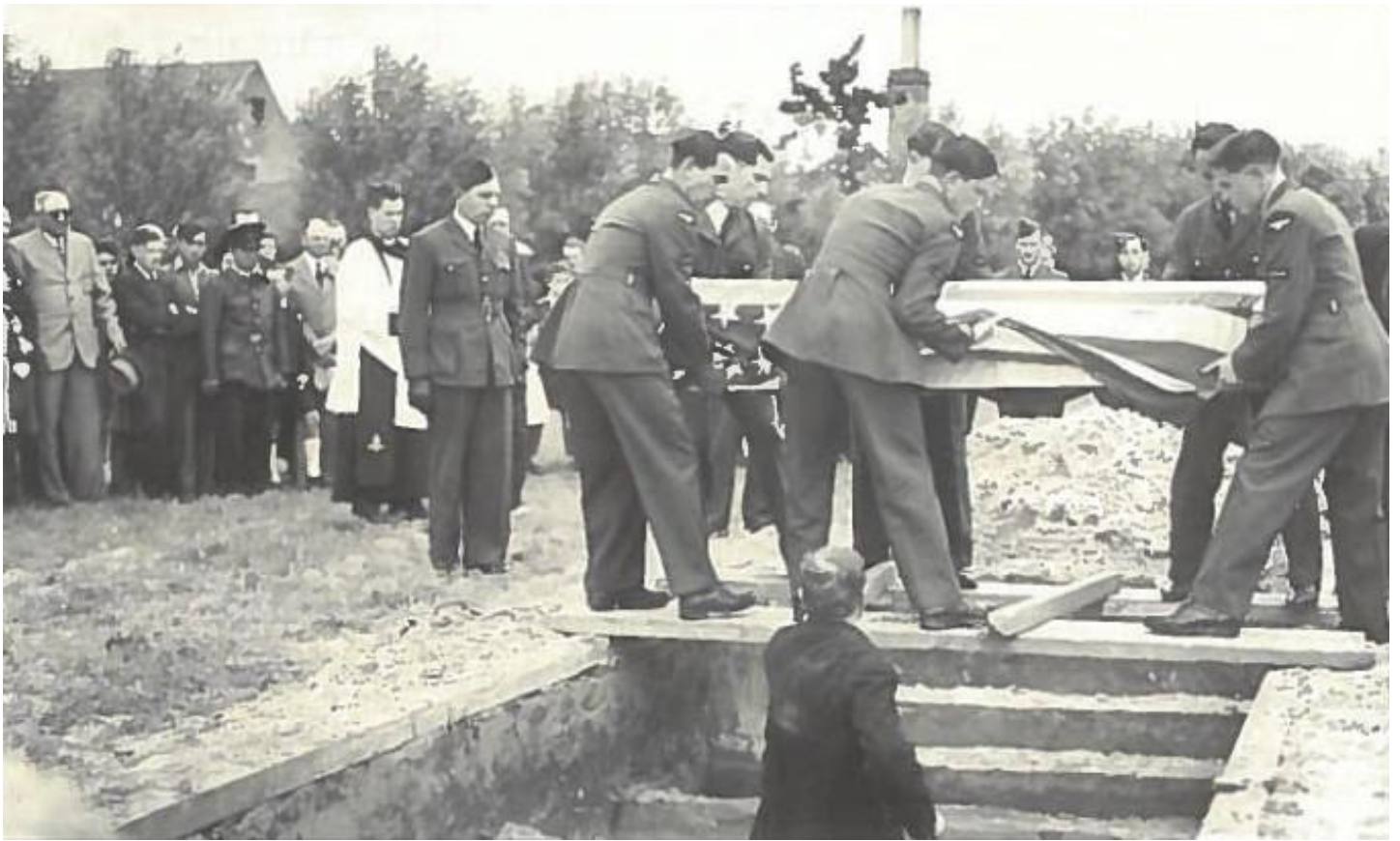
De bemanningsleden werden ontgraven door het Amerikaans leger op 15 augustus 1945 en overgebracht naar de grote Amerikaanse begraafplaats van Margraten bij Maastricht in Nederland.