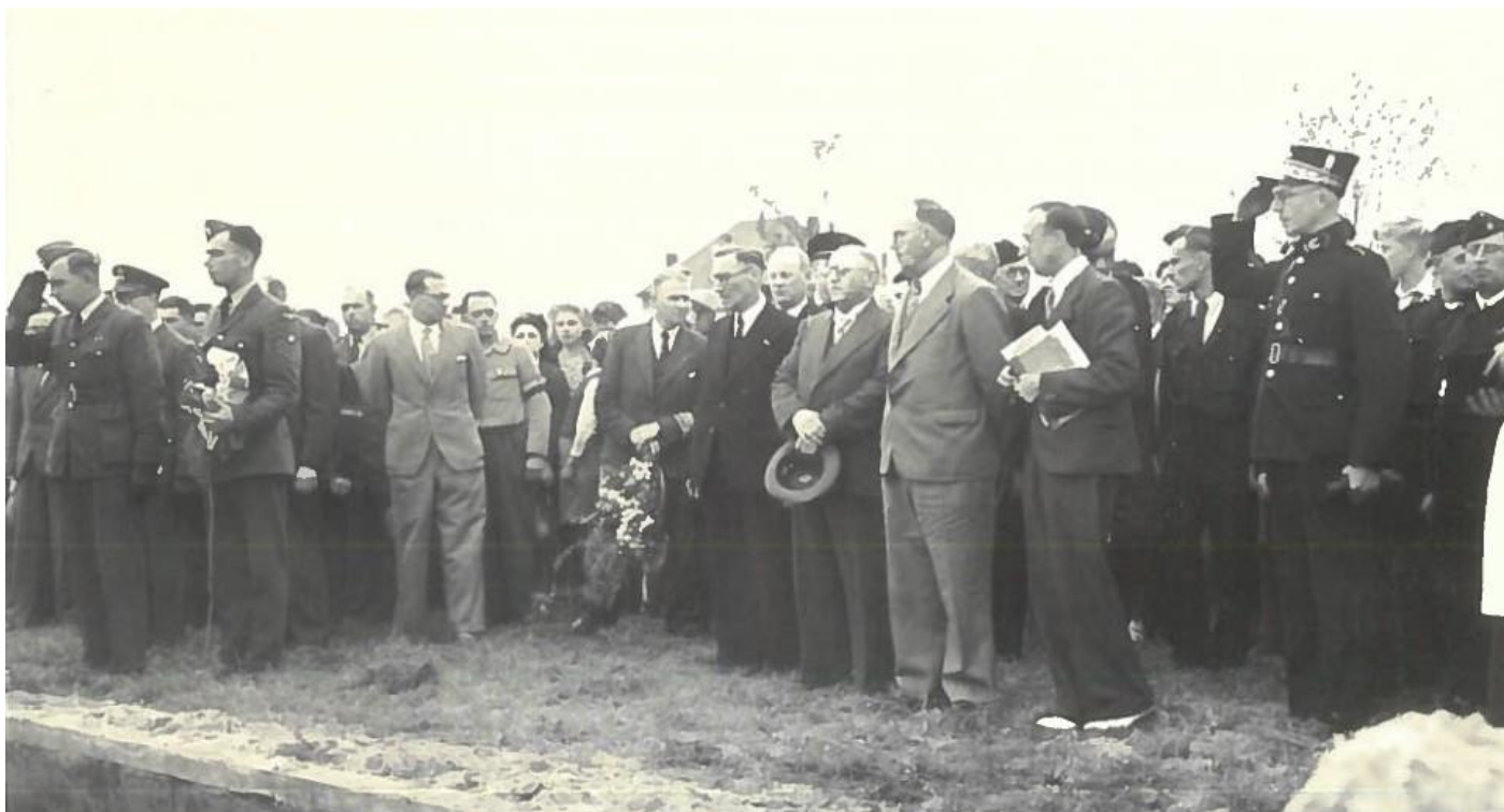
Gemeentelijke Begraafplaats te Knokke, 3 juni 1945.